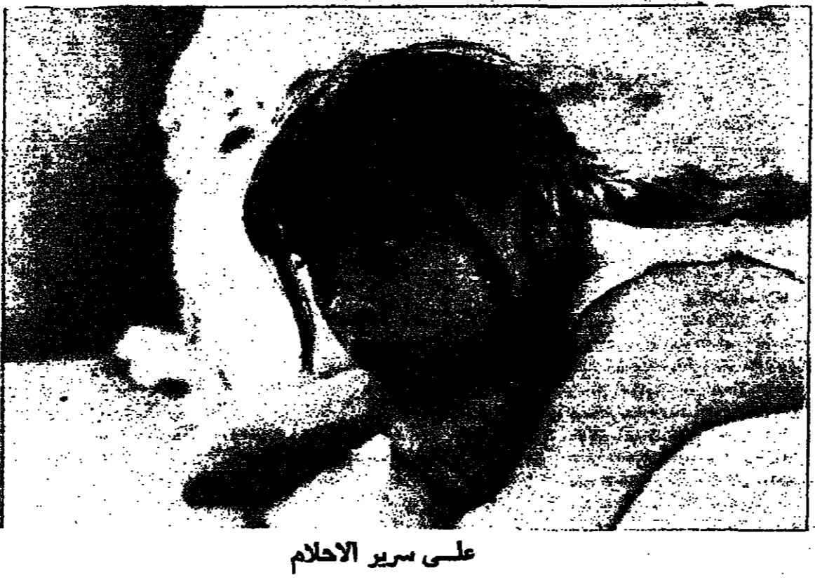
على سير الاحلام